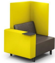
(Ausführung mit ET3Li)