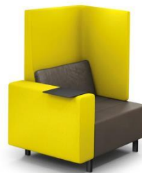
(Ausführung mit ET3Re)