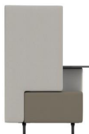
F3/R3 SH 45 cm