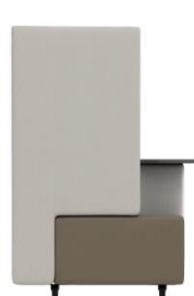
F2/RW SH 40 cm