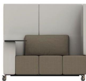
R3-FH1 SH 42 cm