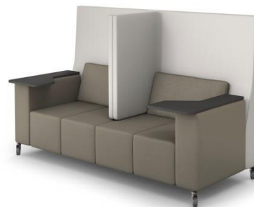
Alternative Montagemöglichkeit mit den gleichen Modulen