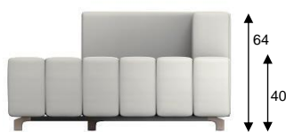
F2 / SH 40 cm