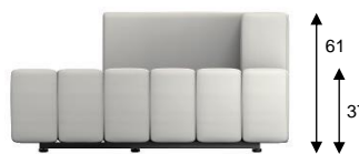
F1 / SH 37 cm