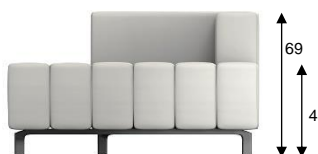
F3 / SH 45 cm