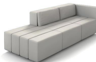
(Fußausführung mit F1)