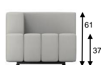
F1 / SH 37 cm