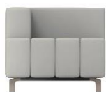
F3 / SH 45 cm

Die Rückenkissen sind optional und werden nicht zwingend benötigt.