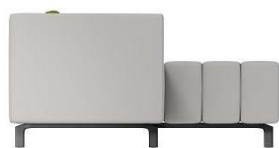
F3 / SH 45 cm