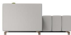
F2 / SH 40 cm