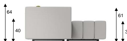
F1 / SH 37 cm